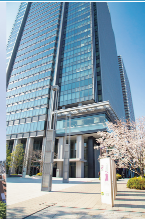
2008年 モード学園 スパイラルタワーズ