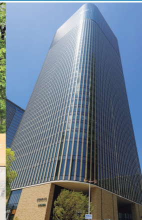
2016年 JO-TERRACE OSAKA