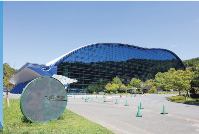
2004年 九州国立博物館 I区