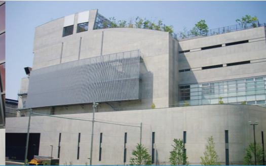
2013年 中央環状新宿線大橋換気所 (設計・工事監理)