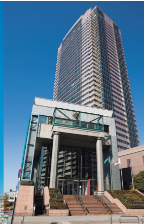
1994年 恵比寿ガーデンプレイス