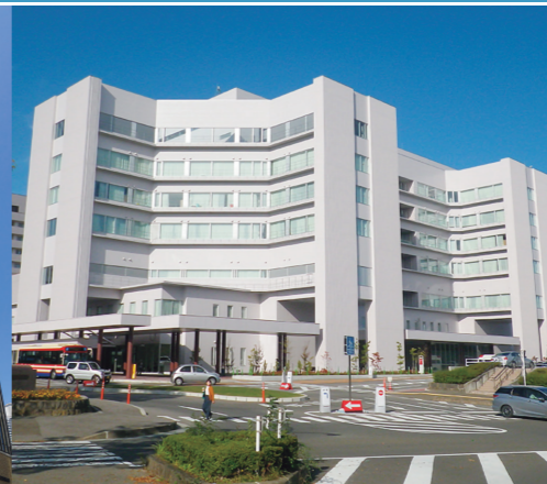
2017年 中之島フェスティバルタワー ・ウエスト