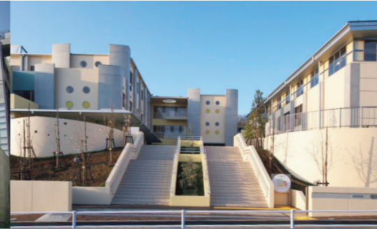
2015年 稲城市立南山小学校 (設計・工事監理)