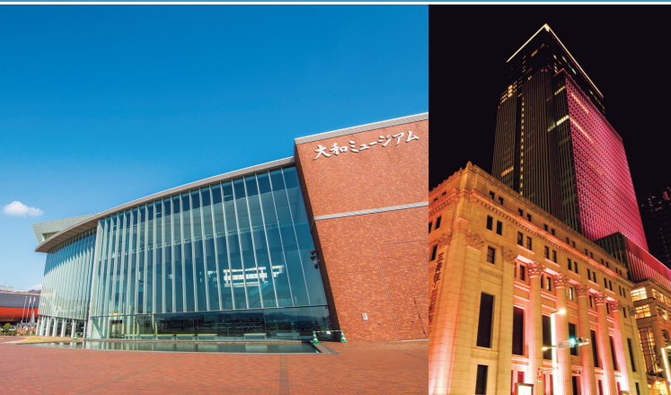
2005年 呉市海事歴史科学館 (大和ミュージアム)