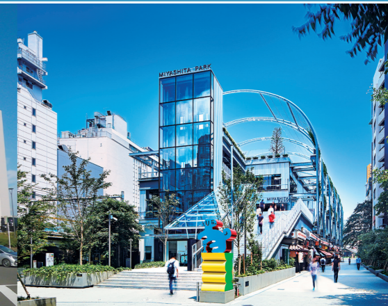
2017年 ふくしま国際医療科学センターD棟