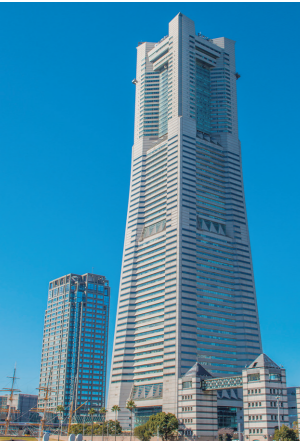
1993年 横浜ランドマーク タワー