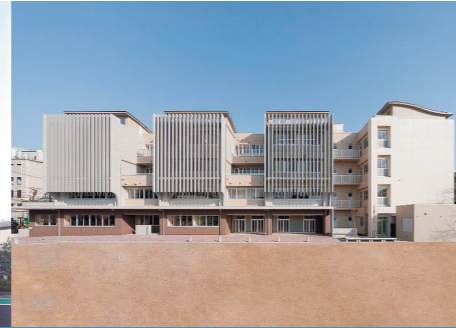
2011年 八王子市立第五中学校 (設計)