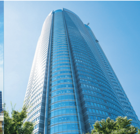
2003年 六本木ヒルズ森タワー