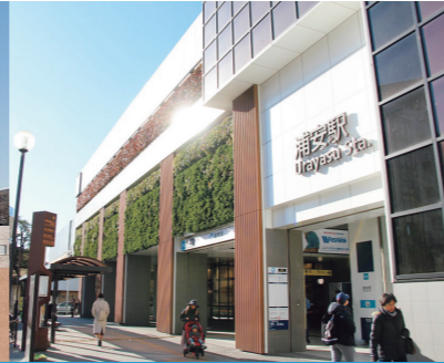
2013年 東京メトロ 東西線 浦安駅 (設計)