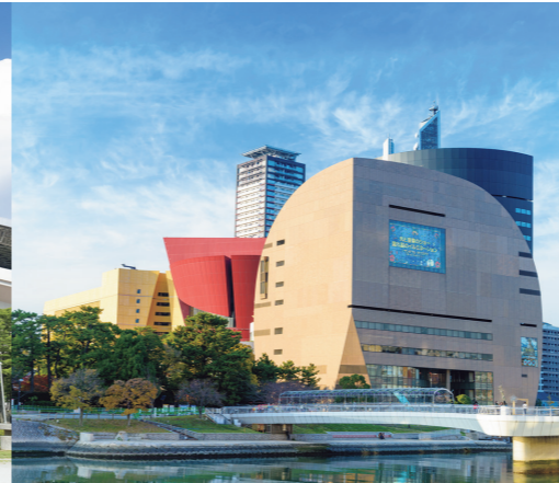
2003年 リバーウォーク北九州