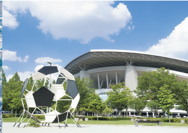
2001年 埼玉スタジアム2002