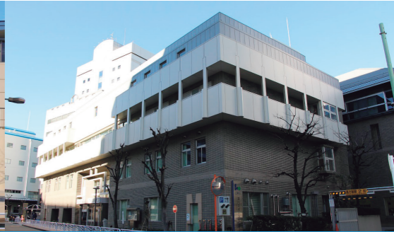
2016年 江東区深川スポーツセンター (改修設計・工事監理)